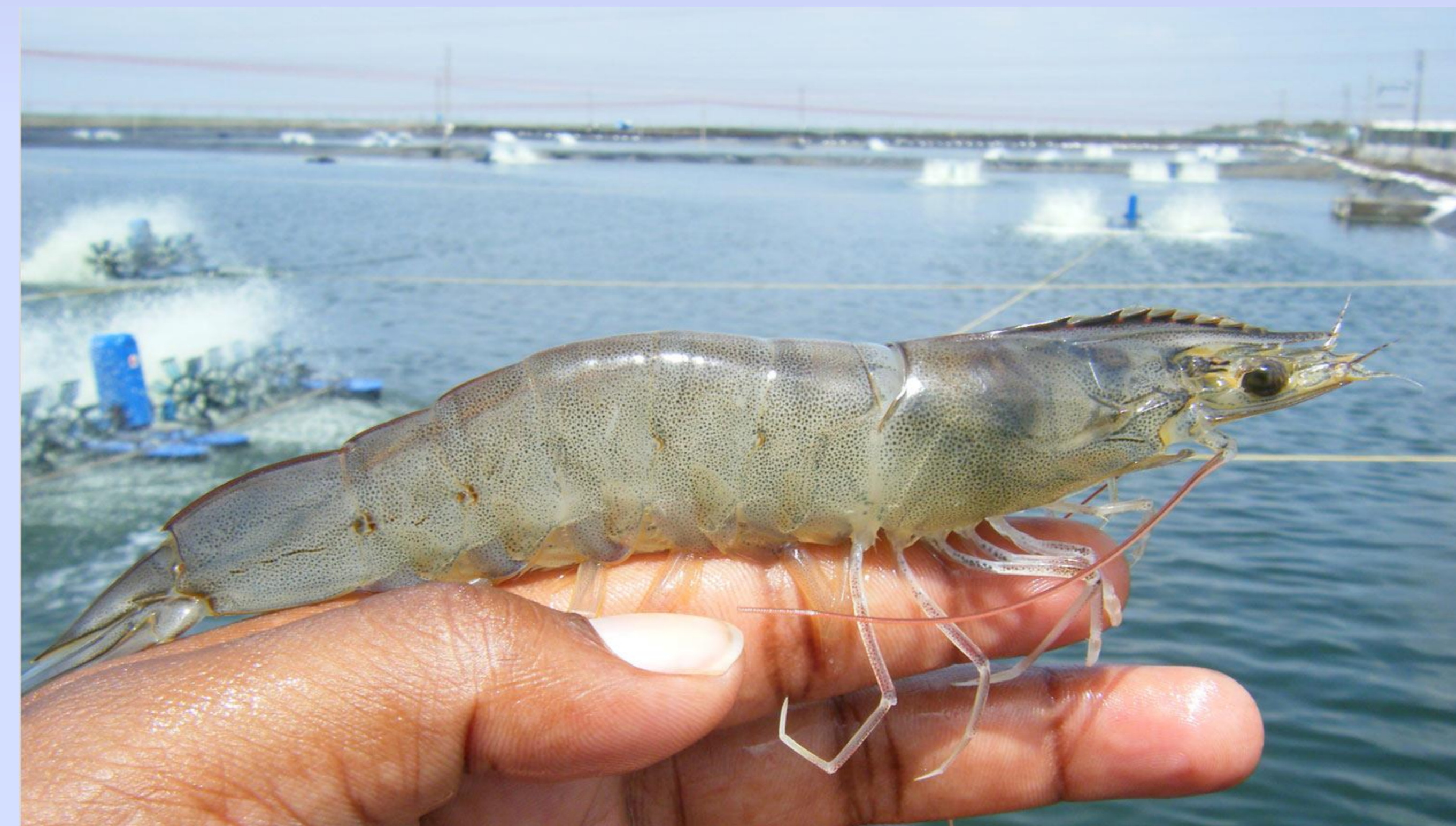
Aspecto normal del camarón